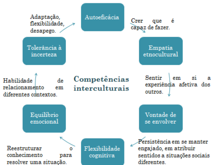
Imagem 1: dimensões das competências interculturais