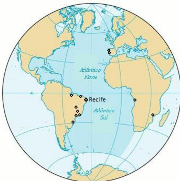
Mapa de situação dos Institutos Confúcio Lusófonos.

A criação de um Instituto Confúcio Modelo na UPE parece apontar para Recife como a sede preferencial para um eventual Centro Multirregional Lusófono. A geografia também favorece esse arranjo. Uma olhada ao mapa-múndi irá mostrar que Recife está mais ou menos no “centro de